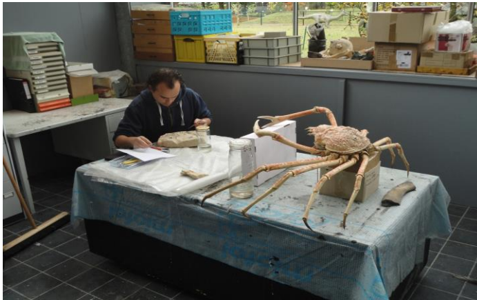
Afstudeerder aan het werk

Het Oertijdmuseum geeft jaarlijks studenten van uiteenlopende onderwijsinstellingen de kans leerervaring op te doen in een professionele setting. Inmiddels wordt er structureel aan stagiaires en studenten gelegenheid geboden om stage te lopen of afstudeeronderzoek te doen. De begeleiding hiervan heeft in het verslagjaar een enorme versterking gekregen door de aanstelling van de conservator/curator. De afgelopen twee jaar hebben studenten van respectievelijk, Aardwetenschappen (UU), Marketing & Communicatie (HAS, Avans en Fontys), Sint Lucas (mbo en hbo creative community), Reinwardt Academie, Helicon en Larestein (mbo groenopleidingen) hier een (tijdelijk) plekje gevonden.